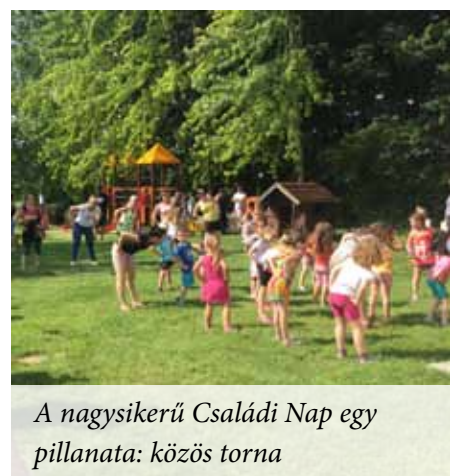
A nagyszerű Családi Nap egy pillanata: közös torna