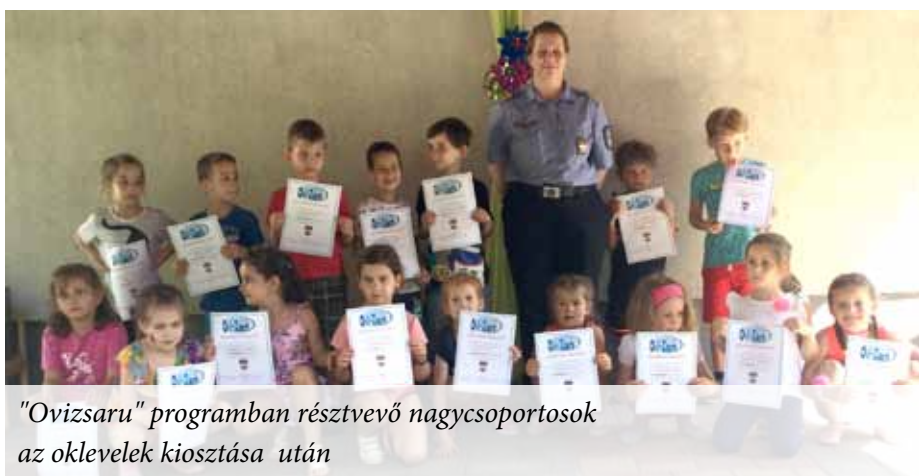
"Ovizsaru" programban résztvevő nagycsoportosok az oklevelek kiosztása után