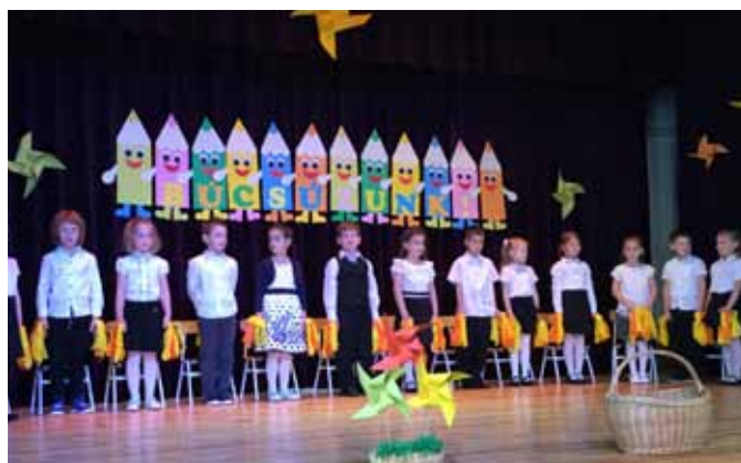
A ballagó óvodások a Faluház színpadán