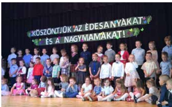
Óvodai anyák napi ünnepség