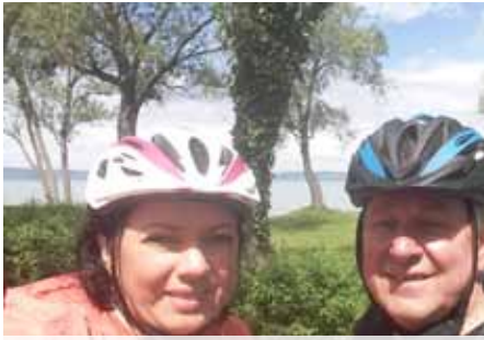
2. sz. csapat: